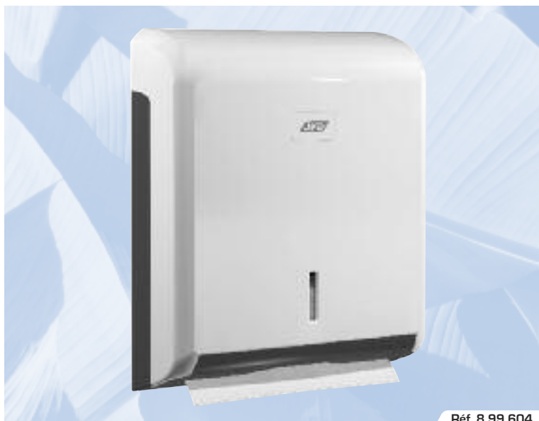
Réf. 8 99 604