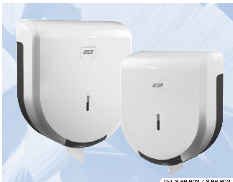
Réf. 8 99 603 / 8 99 602