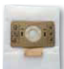
Pochette 10 sacs microfibre classe M KTRI04794 (SA 10)