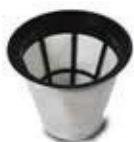
Filtre tissu KTRI03023 (3833)