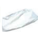
Filtre nylon cylindrique H 75 mm FTDP41884 (AA 155)