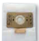
1 x sac microfibre classe M