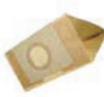
Pochette 10 sacs double parois 8 litres KTRI04968 (SA 148)